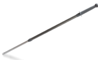
TELESCOOPSTEEL 100-160 CM